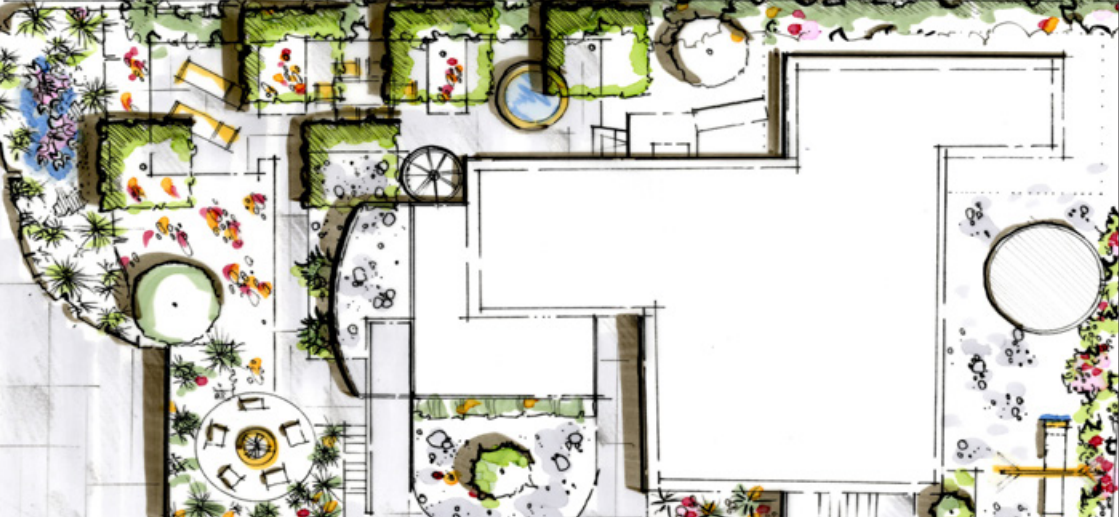
Grundrisse und Handzeichnungen illustrieren planerische Räume.