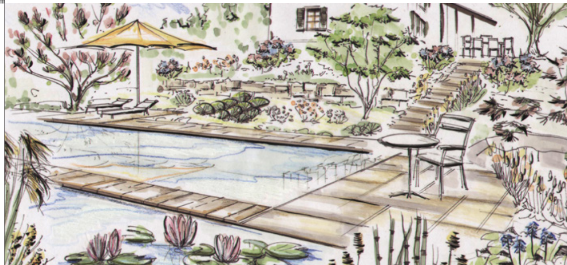
Die Ansichtshandzeichnung visualisiert Gartenträume.

Ganz egal, ob Sie eine Neu- oder Umgestaltung Ihres Gartens wünschen, ob Sie Ihr Zuhause mit einem Schwimmteich oder Naturpool bereichern, Ihren Traumgarten mit Licht und lebendigem Wasser vollenden – wählen Sie ganz einfach aus drei Planungsmodulen das für Sie geeignete Paket. So werden Ihre individuellen Wünsche Realität. Copyright-Hinweis: Nach Projektabschluss sind die Eigentumsrechte an der erstellten Gartenplanung beim Auftraggeber.